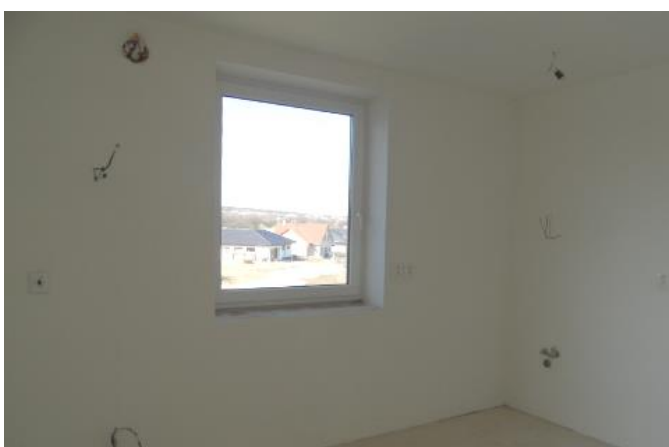
v interiérech chybí nášlapné vrstvy podlah i dveře včetně zárubní, chybí vybavení kuchyně