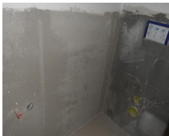
v samostatném WC je příprava na WC typu Geberit a na umyvadlo