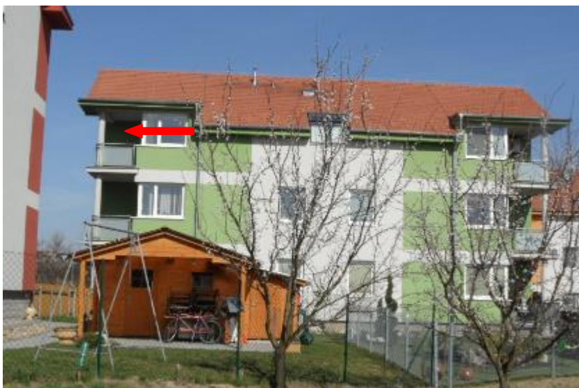
jihozápadní terasa posuzovaného bytu