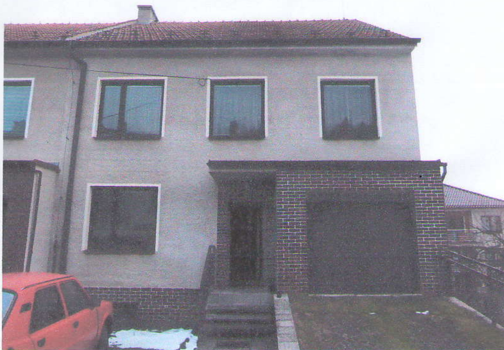
Pohled ze dvora – zahrádka