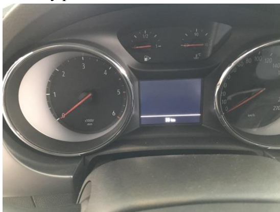
Sdružené přístroje vozidla